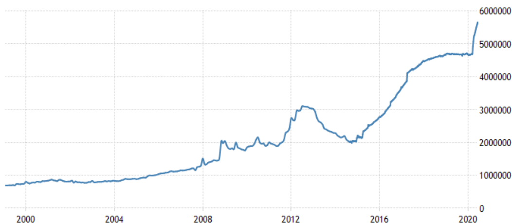
Figure 3: Balanço patrimonial do Banco Central Europeu (em milhões de euros), 2000-2020

SOURCE: TRADINGECONOMICS.COM | EUROPEAN CENTRAL BANK