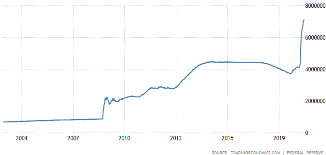
Figura 2: Balanço patrimonial do sistema do Banco Central americano (em milhões de dólares), 2000-2020